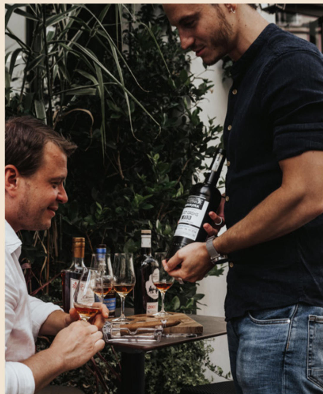
Masterclass rum À partir de 40€ / personne