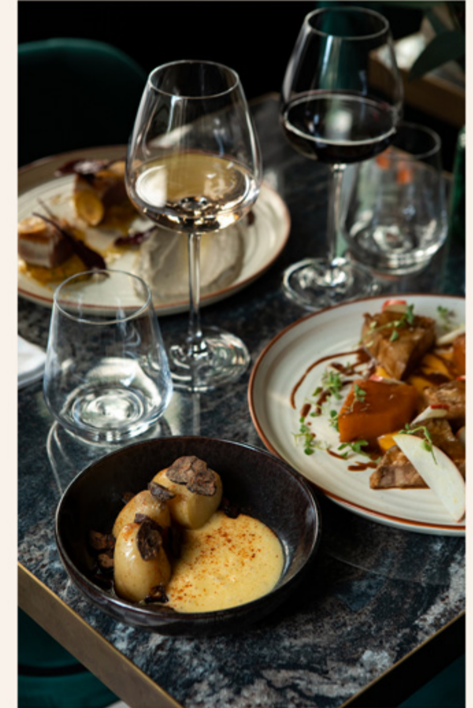
En fonction de vos envies Sur devis