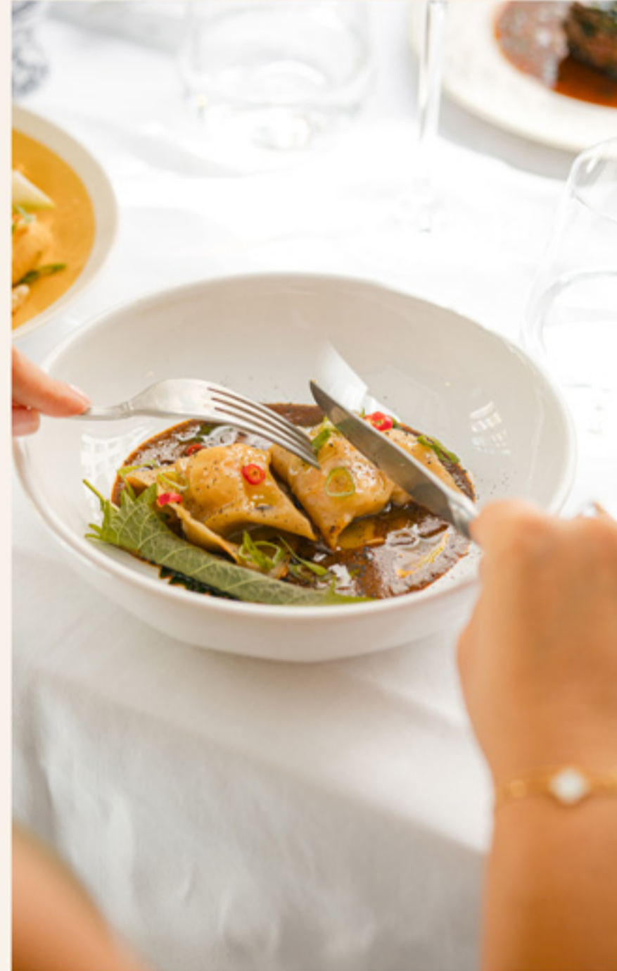
Entrée + Plat + Dessert Eau & Café À partir de 49€ / personne