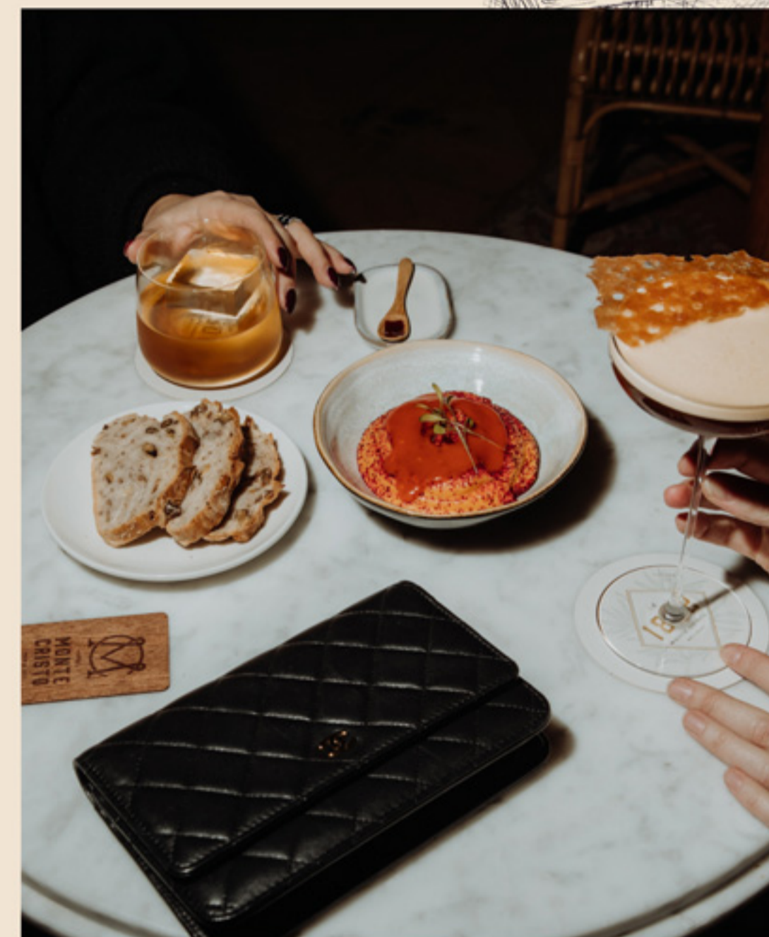
Accords mets & rhums Sur devis