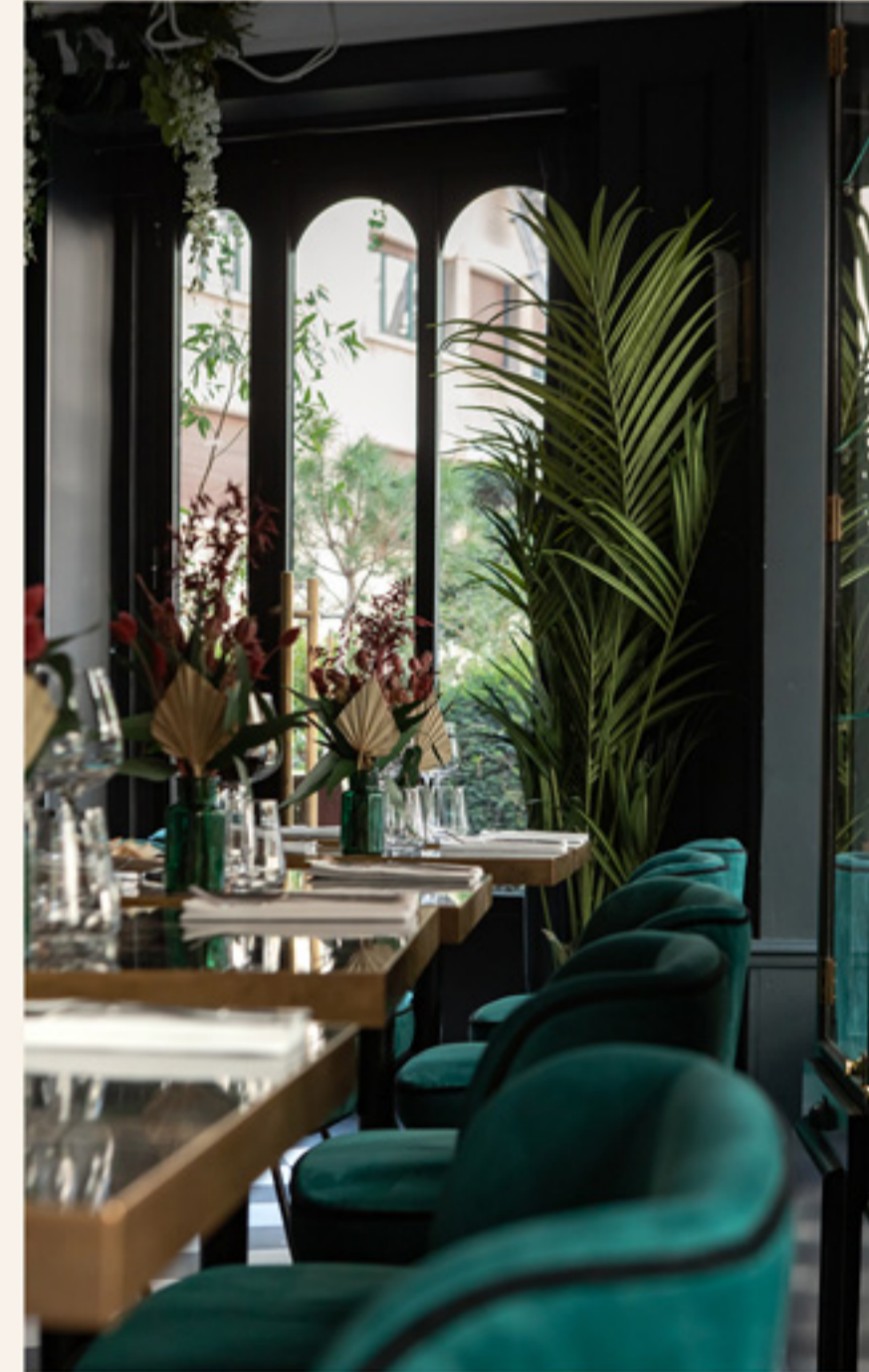
Déjeuner ou dîner assis Jusqu'à 18 personnes