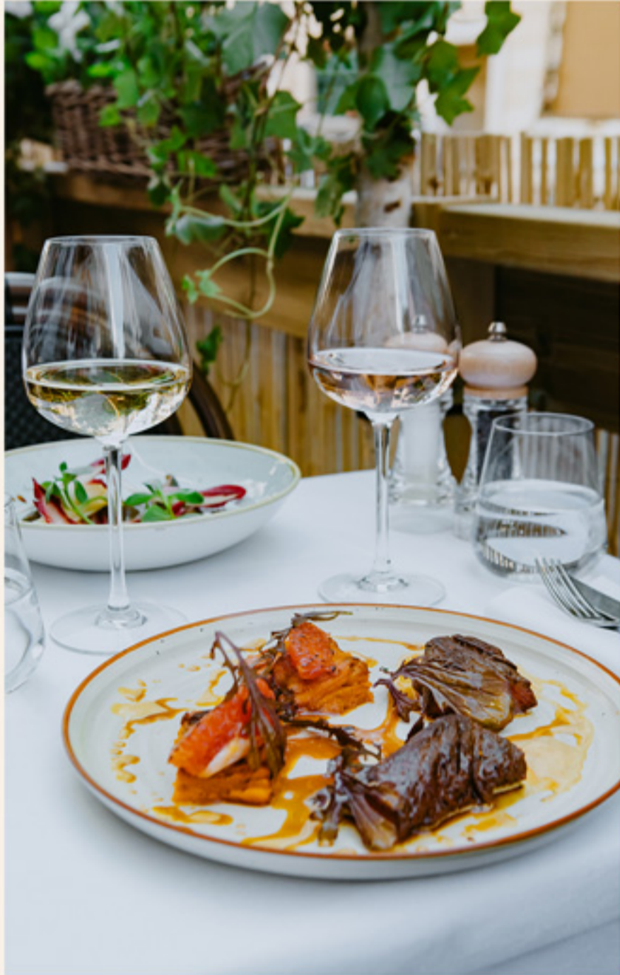
Plat + Dessert À partir de 42€ / personne