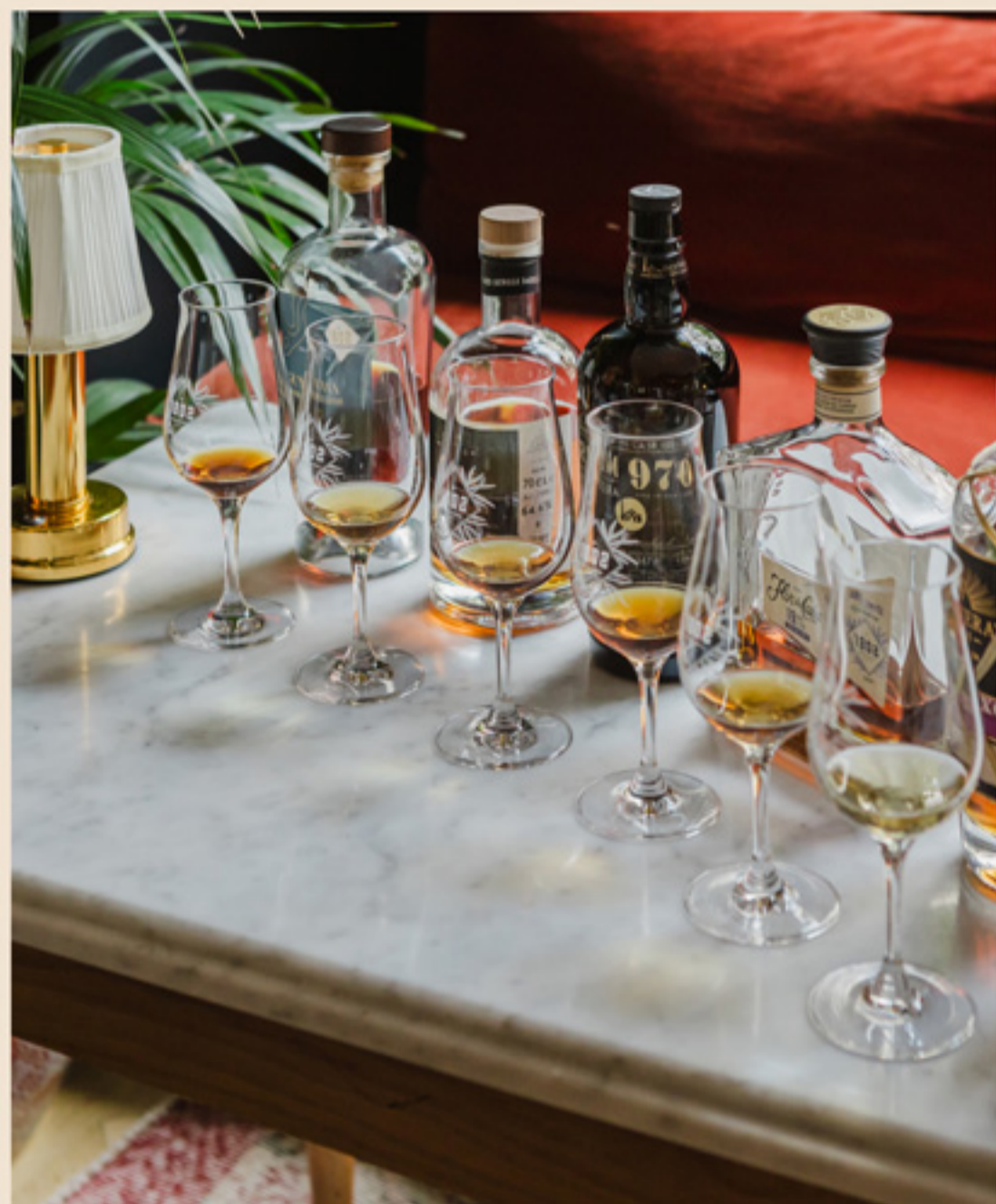
Dégustations guidées À partir de 8€ le verre de rum